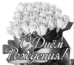
Дети, внуки, правнуки.

К тебе обращаемся мы Отметим все вместе мы рады Наступление девяностой весны! Пусть будет поменьше морщинок Вокруг твоих радостных глаз. Совсем не бывает слезинок Или необдуманных фраз! Побольше здоровья, родная, Заботы, тепла близких рук. Мы любим тебя, дорогая, Ведь ты наш родной человек!